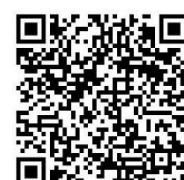
宮盲 Diary (facebook)